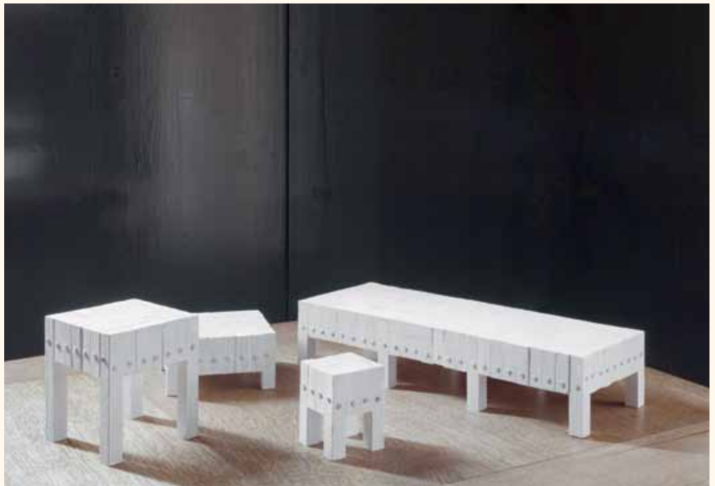
Maquettes van het meubelproject voor Maniera

We betrokken er trouwens – als we het academisch benaderen – referenties bij die ook voor ons nieuw waren: de anonieme architectuur van de grootstad. We laten ons niet alleen inspireren door de klassieke bouwkunst of de Italiaanse renaissance, maar ook door de buitenwijken van New Delhi uit de jaren 1960, waar gebouwen staan die een kracht en kwaliteit uitstralen die doet denken aan de architectuur van het oude Rome. Je kunt hetzelfde zeggen over het moderne Athene – en dat brengt ons bij de meubels voor Maniera. In onze Typology -boeken focussen we op dat banale en haast anonieme architecturale erfgoed. We vinden dat zeer relevant en bijzonder inspirerend. Dat geheel aan referenties wordt ons instrument. Het is een soort catalogus van beelden van wat we hebben gezien, gemaakt door de dingen te observeren en te tekenen. Afbeelden en hertekenen zijn manieren om ons die referenties toe te eigenen. Zo worden ze basis-materiaal voor nieuwe ontwerpen. Als die gevonden architectuur tot stand komt in welbepaalde omstandigheden, op een bepaalde plaats en op een bepaald moment