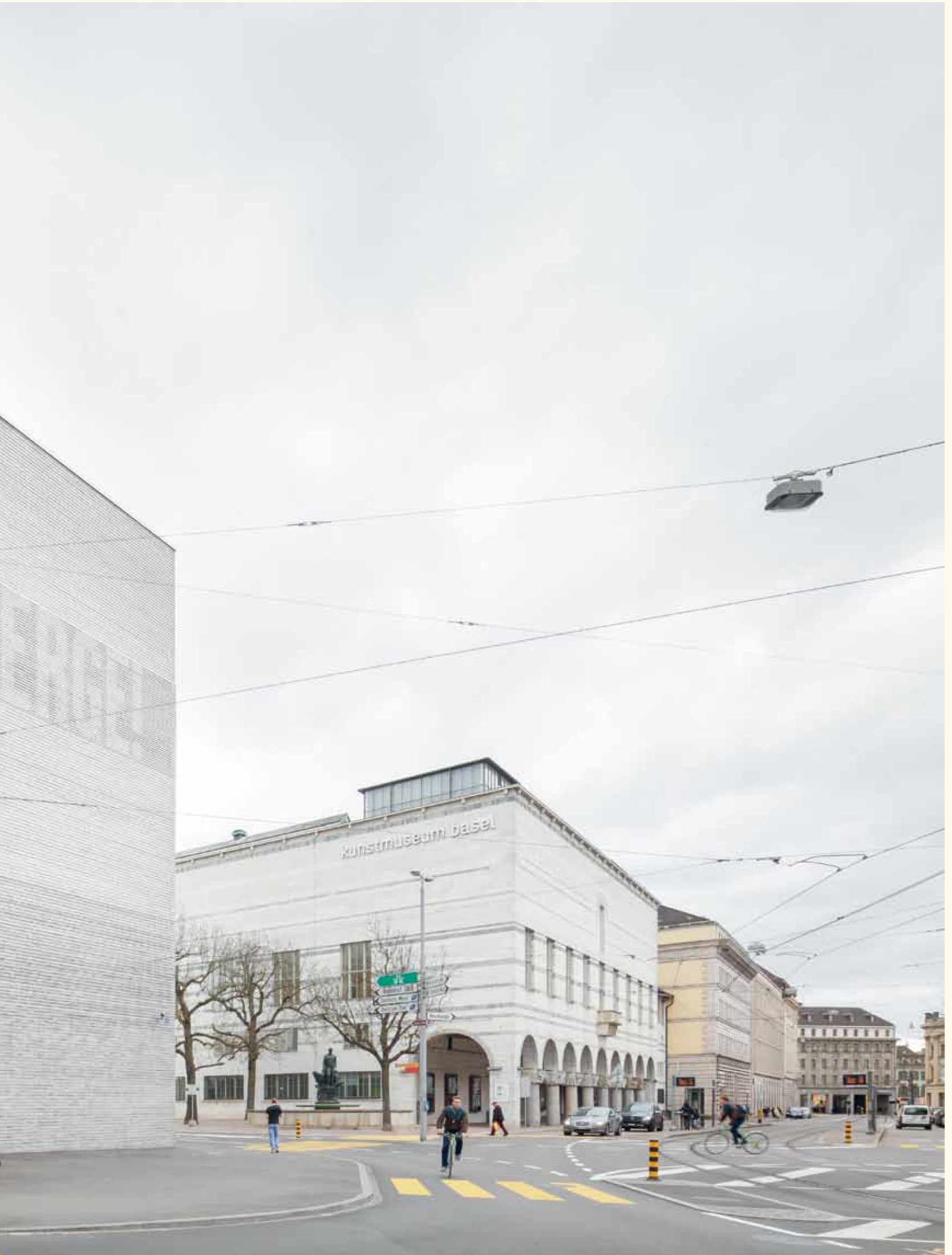
Kunstmuseum Basel, de lichtfries bestaat uit bakstenen met geïntegreerde LED verlichting, gerealiseerd door iart, Basel