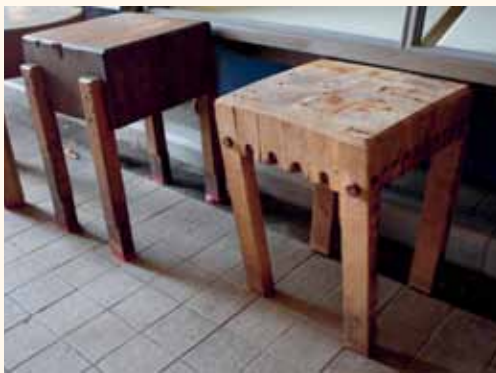
Hakblok, vismarkt, Athene