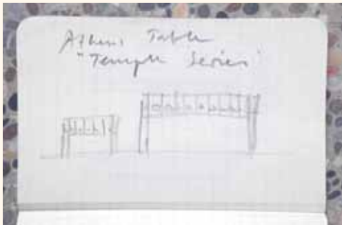
Ontwerpschets van het meubelproject voor Maniera

in de geschiedenis, dan proberen wij na te gaan tot op welke hoogte het mogelijk is een vorm uit zijn specifieke context te halen en de herinterpreteren.