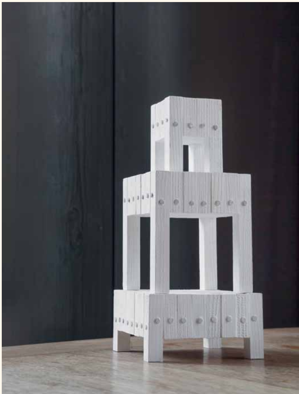
Maquettes van het meubelproject voor Maniera