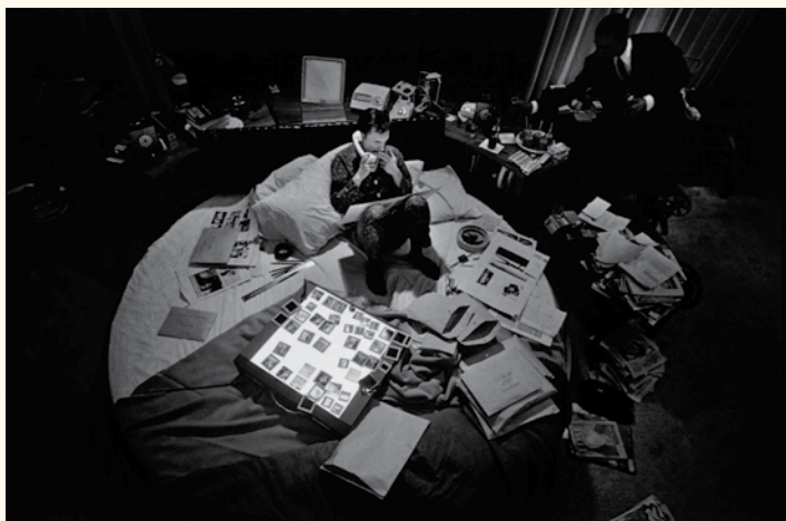
Hugh Hefner, Playboy, 1962

Intellectuele arbeid maakt een geruisloze revolutie door. We werken steeds minder op kantoor en steeds vaker thuis of op alternatieve locaties. Het web verbindt al die spelers tot één wereldmarkt zonder vaste adressen. Dat creëert kansen en verbetert de work-lifebalance. Leuk, toch? Misschien, maar de ruimtelijke impact is enorm. Woningen zijn niet berekend op hun kantoorfunctie; kantoren krimpen tot vergaderkamers; mensen met een laptop koloniseren publieke plaatsen; de wereldwijde concurrentie zet arbeidsrelaties onder druk. Alleen de grootste bedrijven gaan de andere kant op: die willen van hun kantoren net een thuis maken. Verwarring. Dis-array.